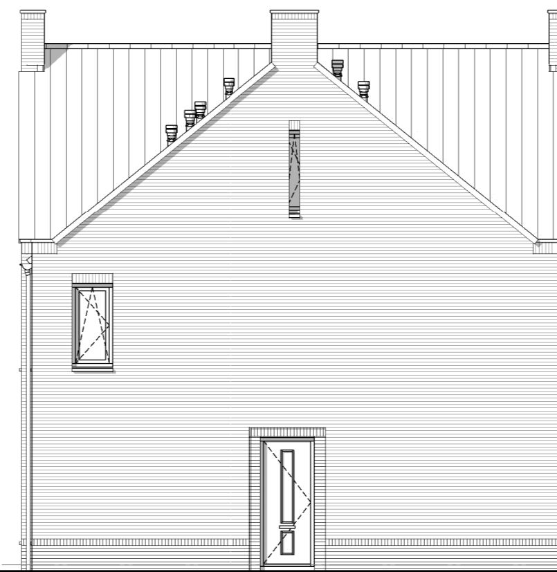
Type F bouwnr.: 17