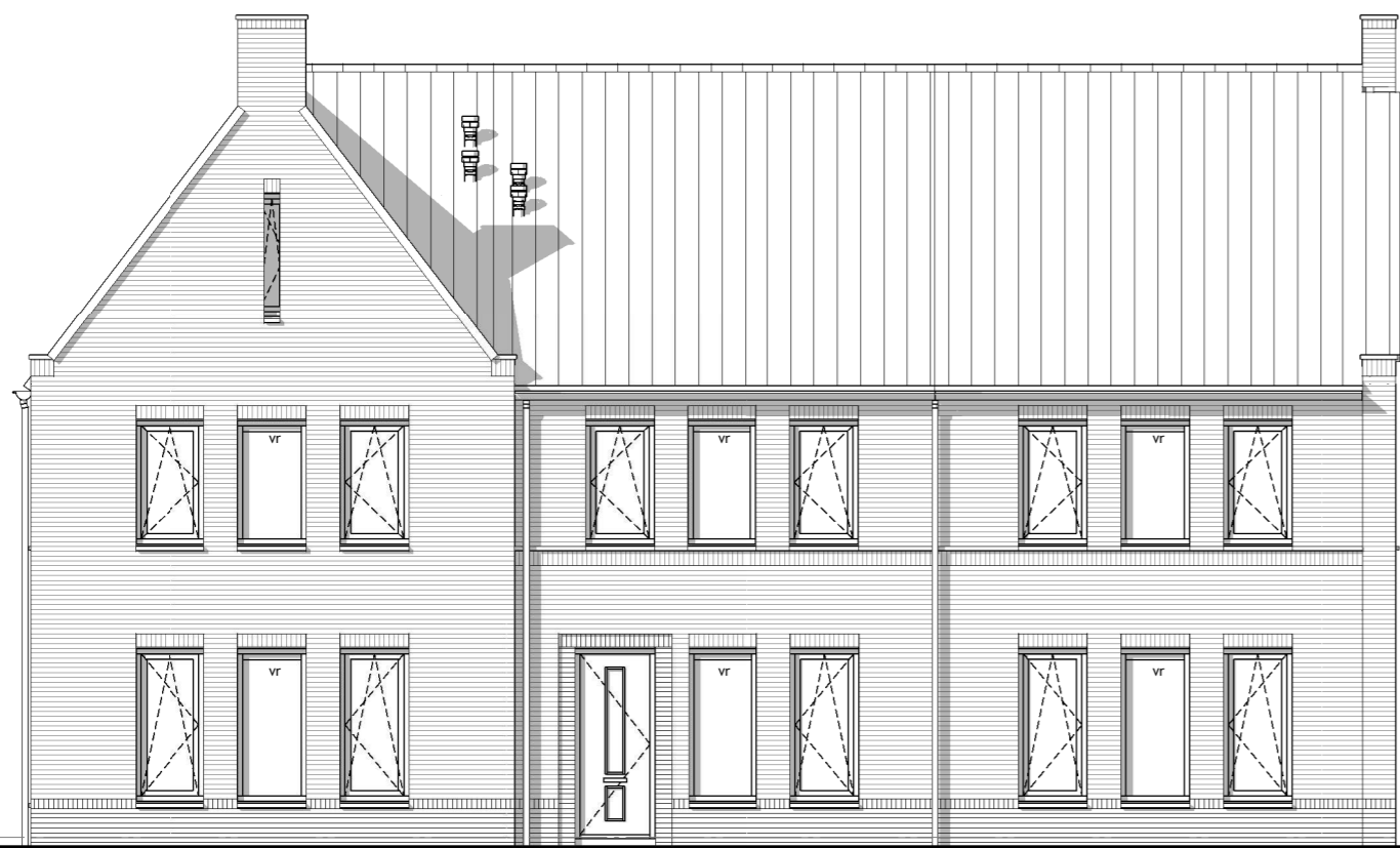
Type G bouwnr.: 15