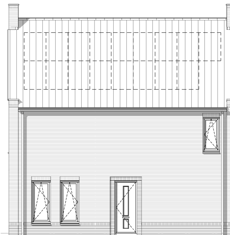
Type G bouwnr.: 15