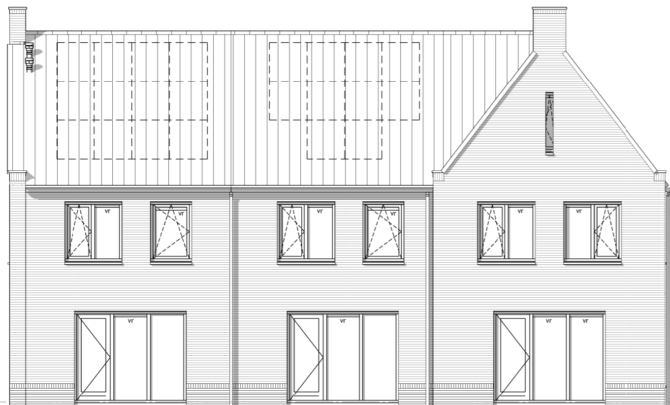
Type F bouwnr.: 17